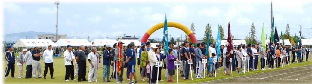
開会式に整列する各地区の皆さん