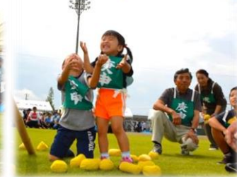
『背伸びの運動 大きくなあれ』