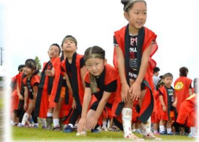
幼稚園児による『南中ソーラン』