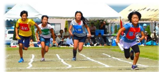
『地区対抗リレー(女子)』