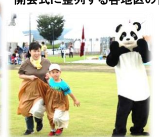
保育園児による『親子でデカパン』