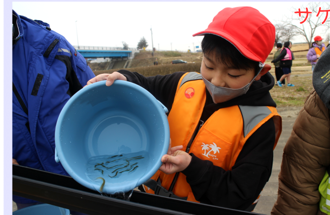
稚魚が傷まないようやさしく慎重に

3月5日(火)、旧北上川の豊里水辺の公園で、豊里小・中学校5年生54人が、サケの稚魚39万匹の放流を行いました。