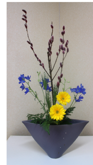
黄色と青、そしてピンクのネコヤナギのコントラストがステキですね

春がもうすぐそこに感じられるような暖かい日が続いた日から一変、一気に雪が降り積もり、一面が真っ白になった2月22日(木)、平筒沼学習館研修室で、「いけばな教室第5回